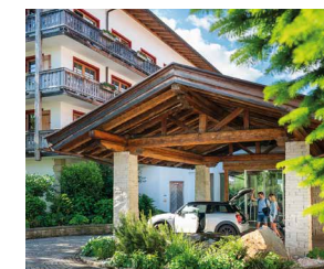
Check-In im Hotel