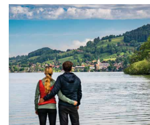
Ausblick auf den Schliersee