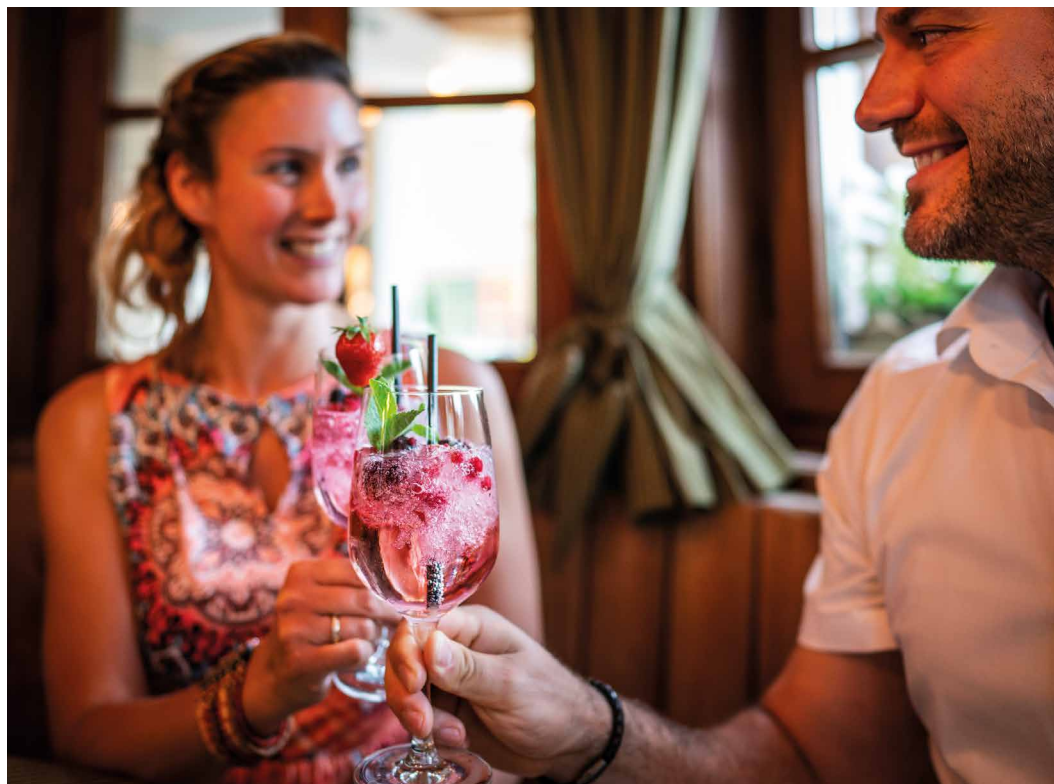
Genuss beginnt bei A, wie Aperitif

Die älteste Ferienroute Deutschlands führt Sie in dieser Reiseidee zum 1 Tegernsee und zum 2 Chiemsee . In atemberaubender See-Kulisse und Bergpanorama genießen Sie gleich 2 Hotels der Spitzenklasse. Rund um den Tegernsee und den Chiemsee finden Golfbegeisterte ein wahres Eldorado zum Golfen in Oberbayern. Ausgezeichnete Spitzengastronomie sowie Wellness und Erholung machen das Genuss- und Sportpaket komplett.