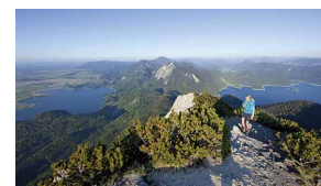
Kochelsee und Walchensee (Herzogstand)

Schlehdorf und Kochel am See bieten ganz besonders idyllische Badeplätze. Im Freilichtmuseum Glentleiten www.glentleiten.de erlebt man Oberbayern an einem Ort. Perfekt ergänzen lässt sich der Ausflug mit einem Besuch im Kloster Benediktbeuern www.benediktbeuern.de , der historischen Marktstraße in Bad Tölz www.bad-toelz.de oder einen Ausflug mit der Familie auf den Blomberg www.der-blomberg.de . Rund um den Lenggrieser Hausberg Brauneck warten außergewöhnliche Ausblicke und Hütten sowie der beliebte Höhenweg www.brauneck-bergbahn.de ; Entspannung pur bietet das Erlebnisbad Isarwelle mit Wildwasser-Strudel und Bergblick www.isarwelle-lenggries.de