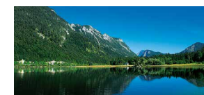
Drei-Seen-Gebiet Reit im Winkl