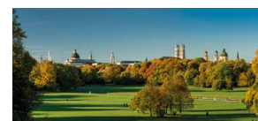
Englischer Garten München

In Garmisch-Partenkirchen laden die beiden Fußgängerzonen mit ihren historischen Städten zu einem Bummel ein, Natur pur erlebt man auf dem 700 Meter langen Weg durch die Partnachklamm; mit der Zugspitzbahn oder der Seilbahn geht es auf Deutschlands höchsten Berg – die fast 3.000 Meter hohe Zugspitze mit goldenem Gipfelkreuz bietet einen fantastischen Ausblick über Garmisch bis nach München.