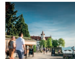
Lindau, hintere Insel