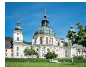
Kloster Ettal Naturpark Ammergauer Alpen