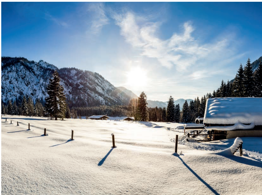
Unberührte Winterlandschaft in Ruhpolding

Winterliche Outdoor-Aktivitäten in der Voralpenregion entlang der Deutschen Alpenstraße bieten vielfältige Möglichkeiten. Die östliche Strecke führt Sie durch die verschneite Winterlandschaft von Bayrischzell 1 über das Sudelfeld und den gleichnamigen Pass, weiter durch das oberbayerische Inntal und den Chiemgau bis zum charmanten Ort Ruhpolding 2 . Die letzte Etappe dieser Route bringt Sie schließlich nach Berchtesgaden 3 , dem östlichsten Punkt der Deutschen Alpenstraße.