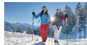
Winterwanderung in Bad Hindelang

Am Spitzingsee heißen die Alpenbahnen Spitzingsee mit Nachtskilaf donnerstags und freitags die Gäste willkommen. In Schliersee lädt das Monte Mare mit seiner Saunawelt und der Vitaltherme zum Entspannen an kalten Wintertagen ein. Verpassen sollten Sie auch nicht den Besuch der oberbayerischen Whiskeydestillerie Slys.