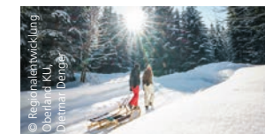
Rodeln am Spitzingsee