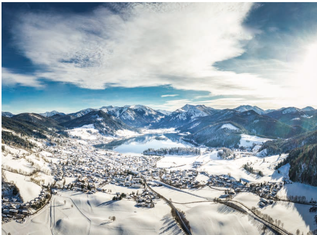
Verschnieetes Schliersee mit gleichnamigem See

Die Deutsche Alpenstraße bietet auch im Winter eine breite Palette an Erlebnissen. In Bad Hindelang 1 , gelegen im Naturschutzgebiet der Allgäuer Hochalpen, stehen Ihnen sämtliche Winteraktivitäten zur Verfügung, die Sie sich wünschen. Garmisch-Partenkirchen 2 , ein bedeutender Wintersportort am Fuße der Zugspitze, ermöglicht Ihnen hautnahe Begegnungen mit der Geschichte des Sports. Im Naturparadies Schliersee 3 , inklusive des Ortsteils Spitzingsee auf 1084 Metern über dem Meeresspiegel, gibt es nicht nur zahlreiche Möglichkeiten für Wintersport, sondern auch Gelegenheiten zur Entspannung und Freizeitaktivitäten.