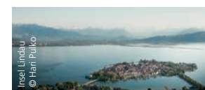
Lindau im Bodensee