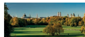
Englischer Garten München

In Tegernsee lädt das weltbekannte herzogliches Bräustüberl zu einem gemütlichen bayerischen Essen ein; in nur 13 Minuten fährt man mit der Wallbergbahn zur Bergstation des Tegernseer Hausberges und erlebt einen atemberaubenden Blick über den Tegernsee; bei einer Schiffahrt über den Tegernsee den grünbläulich schimmernden See hautnah erleben.