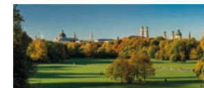
Englischer Garten München

In Tegernsee lädt das weltbekannte herzogliches Bräustüberl zu einem gemütlichen bayerischen Essen ein; in nur 13 Minuten fährt man mit der Wallbergbahn zur Bergstation des Tegernseer Hausberges und erlebt einen atemberaubenden Blick über den Tegernsee; bei einer Schiffahrt über den Tegernsee den grünbläulich schimmernden See hautnah erleben.