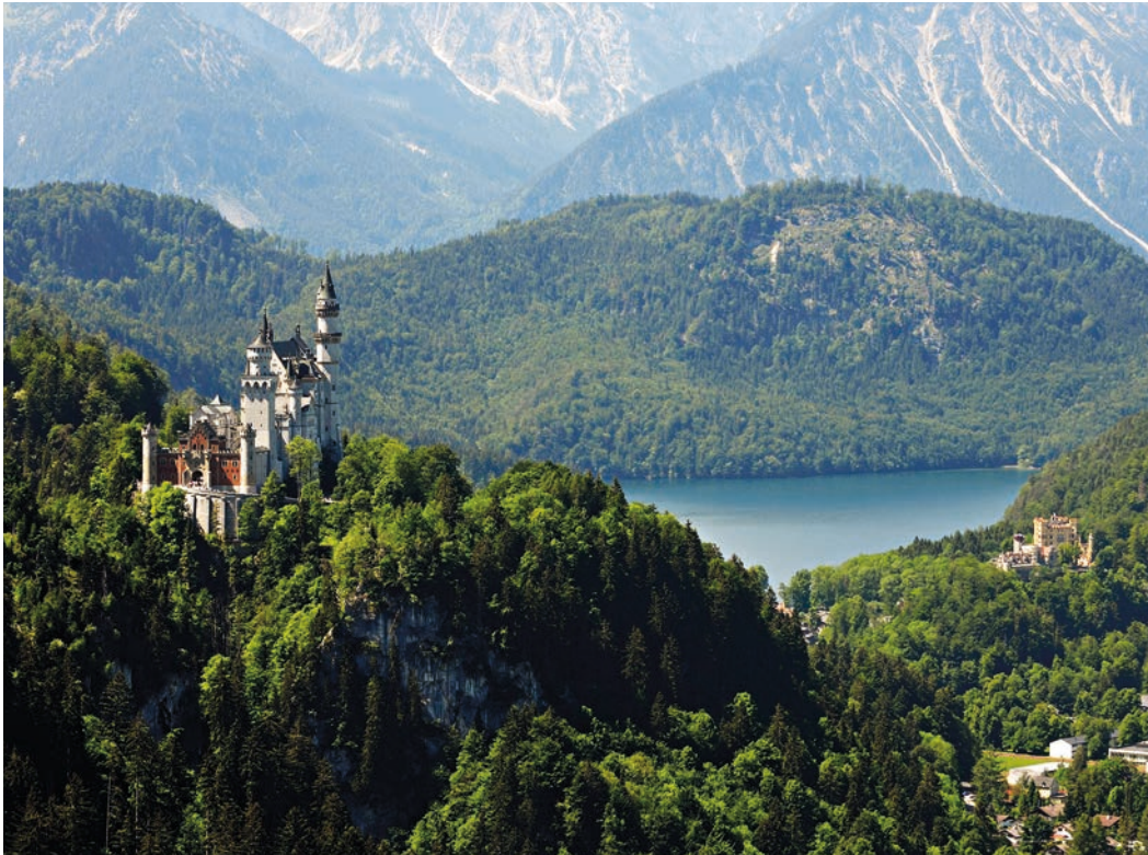
Dorf der Bayerischen Könige am Alpsee mit Schloss Neuschwanstein im Vordergrund

➊ München – die Landeshauptstadt Bayerns und Tor zur Deutschen Alpenstraße, den Bodensee mit der mediterranen Insel- und Gartenstadt ➋ Lindau , das weltbekannte Schloss Neuschwanstein in ➌ Füssen und den Wallberg am ➍ Tegernsee . Die An- und Abreise erfolgt über München.