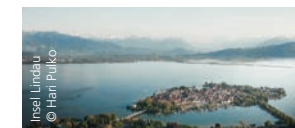
Lindau im Bodensee