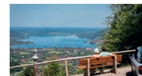
Wallberg Panoramastraße Tegernsee