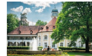
Kurpark Bad Tölz