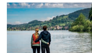
Blick auf den Schliersee