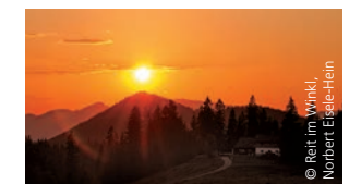
Winklmoosalm Reit im Winkl